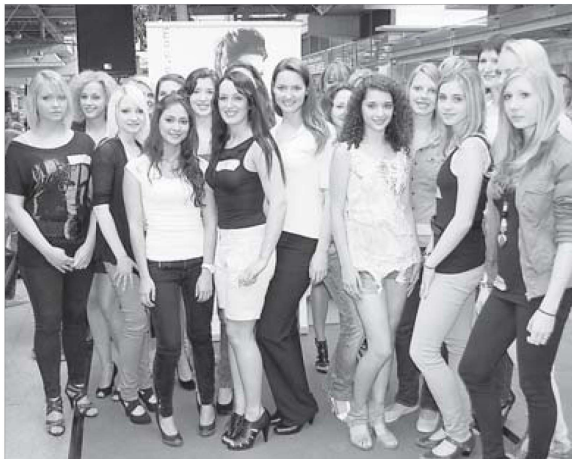
16 Mädchen schafften es am Samstag in den Recall. Fünf von ihnen bekamen das begehrte Ticket fürs Finale. Die anderen fünf Finalplätze waren schon im Vorfeld als „Joker“ verteilt worden. Ab Juli beginnen die Proben für die Modenschauen.